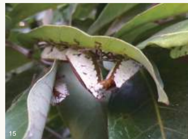
圖14~15. 一般來說，荔枝椿象通常喜歡在枝條或花葉芽上直立式交配，上方的雌蟲仍然邊交配邊吸樹汁（上圖）；剛打破越冬後在龍眼葉下水平式交配的情形則極為罕見（下圖）。