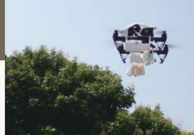
圖20. 利用無人機投放平腹小蜂卵片，進行生物防治，殺死荔枝椿象卵。