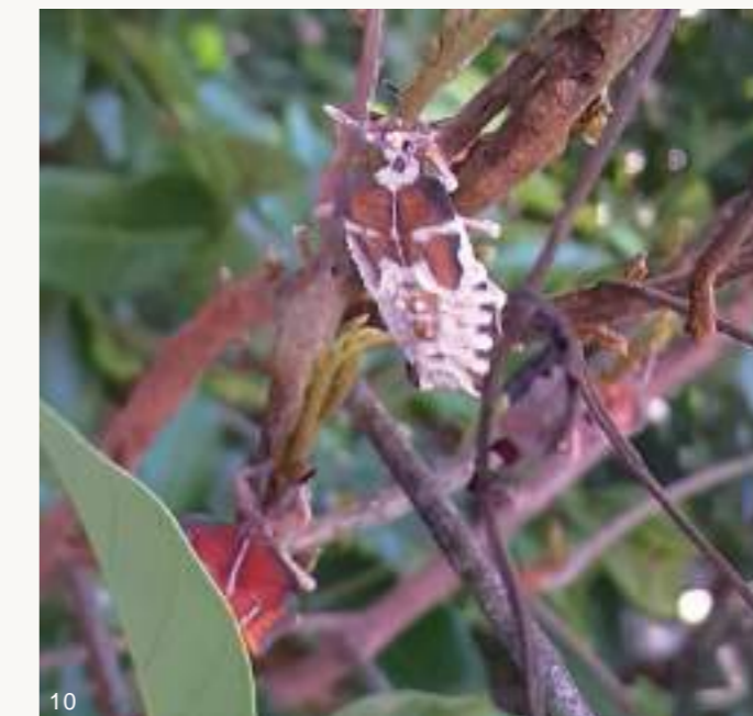
圖10~11. 108年梅雨季前後,大量荔枝椿象若蟲及成蟲感染蟲生真菌而死亡僵直掛在樹上,蟲體內白色黴菌從觸角、足、胸腹部等節間或氣孔、臭腺開孔長出。

寒流,荔枝及龍眼開花量豐,龍眼蜜產量足,但荔枝椿象族群密度也較高。相對的,108年首兩月平均日溫超過16°C為暖冬,無寒流,致使荔枝、龍眼開花結果少而歉收,龍眼蜜也幾乎無收,又加上108年梅雨季前後雨量充沛,若蟲及成蟲個體感染蟲生真菌死亡情形增加,使得該(108)年度荔枝椿象族群數量亦受到衝擊而大幅減少,與107年4~12月同期龍眼樹上荔枝椿象成蟲族群數量具明顯差異。