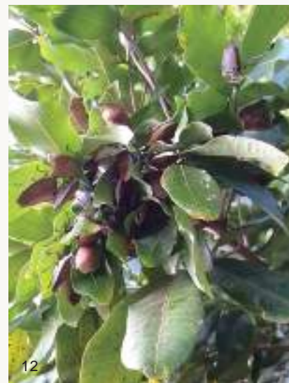
圖12~13. 荔枝椿象在龍眼葉下聚集越冬，此時進入生殖系統發育停止或緩慢的繁殖滯育期，此時不太活動，在樹下通常聞不到椿象臭味。

在臺灣，無患子與臺灣欒樹從10月開始漸漸枝葉稀疏，新羽化的荔枝椿象並不交配，漸漸飛離，銷聲匿跡。有部分可能分散飛至不明處所躲藏，然而它們曾被發現聚集在龍眼樹的葉背，且以成蟲方式度過日照漸短的秋冬。一般在龍眼樹下也以為荔枝椿象都飛走了，因為此時已聞不到椿象臭味。