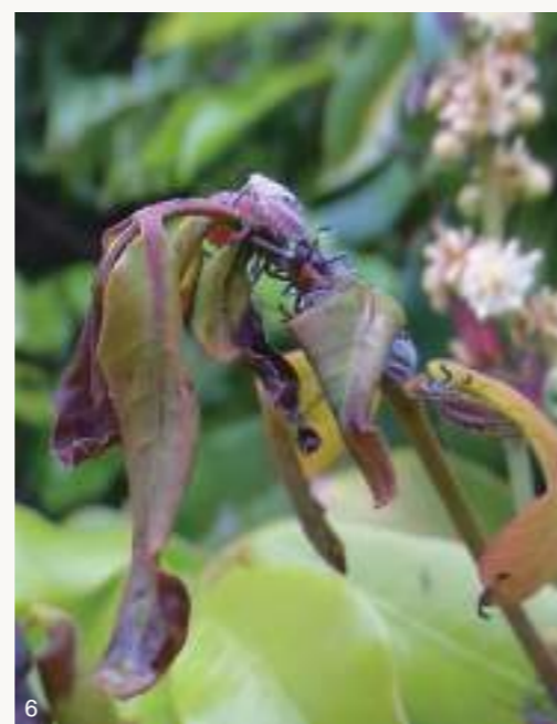
圖4~5. 龍眼大約在二月底至五月抽紅嫩枝葉並開花結幼果,常吸引荔枝椿象前來交配或吸汁,荔枝椿象粗短口針多直接插入花芽、葉芽、嫩枝、花柄或果柄,而非刺進花果或樹幹。