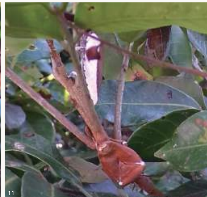
圖10~11. 108年梅雨季前後,大量荔枝椿象若蟲及成蟲感染蟲生真菌而死亡僵直掛在樹上,蟲體內白色黴菌從觸角、足、胸腹部等節間或氣孔、臭腺開孔長出。