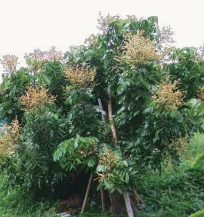
圖1. 龍眼為常綠喬木,在農業區為矮化集約式經營經濟作物。