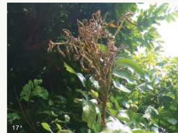
圖16~17. 龍眼葉芽如正常生長，應該會長出許多紅嫩枝葉（上圖）並正常展開逐漸變青綠。但如果發生鬼帚病（下圖），則葉芽無法展開，且組織增生毛呈現簇生狀乾枯情形，開花率亦會降低。