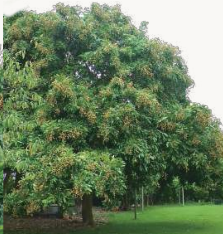
圖2. 在非農業區的低海拔山丘或平地老聚落、廟宇、公園等地極為常見無人管理之高聳散生植株。